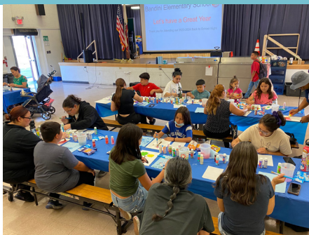
Clubes y actividades extraescolares