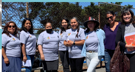
Contratación de un coordinador de padres (para padres/tutores que hablan varios idiomas)