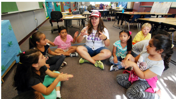
Consejeros y mentores