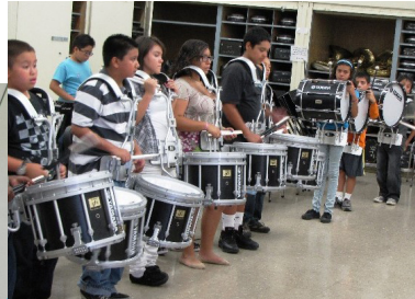
Programas de música y arte

Apoyo académico (por ejemplo, apoyo estudiantil individualizado o tutoría de alta calidad; consulte los 10 elementos de tutoría de alta calidad de Innovate para obtener más información)