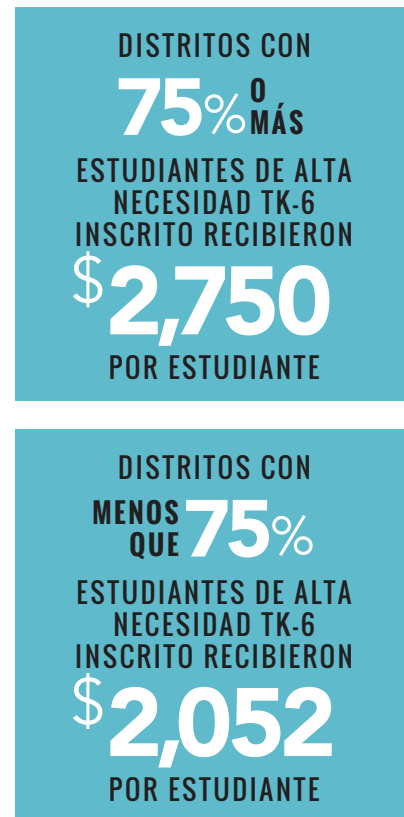
Gráfica 2. ¿Cuánto financiamiento adicional recibieron los distritos a través de ELO-P en 2022-23?

Nota: Algunos distritos escolares pequeños y aquellos que no atienden a un gran porcentaje de estudiantes no duplicados sólo reciben $50.000.