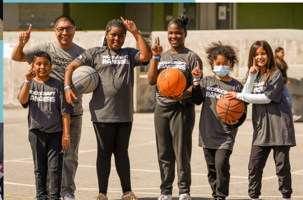
Clubes o ligas deportivas